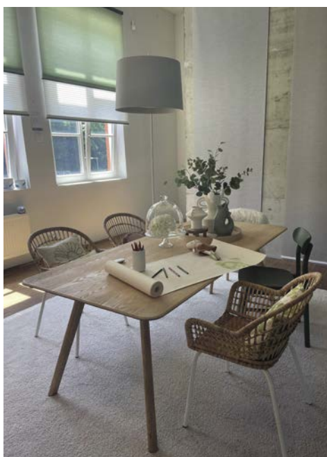
Schöner Look für junge Familien: Wohnwelt Green Living mit Ease Side-by-Side Motor.