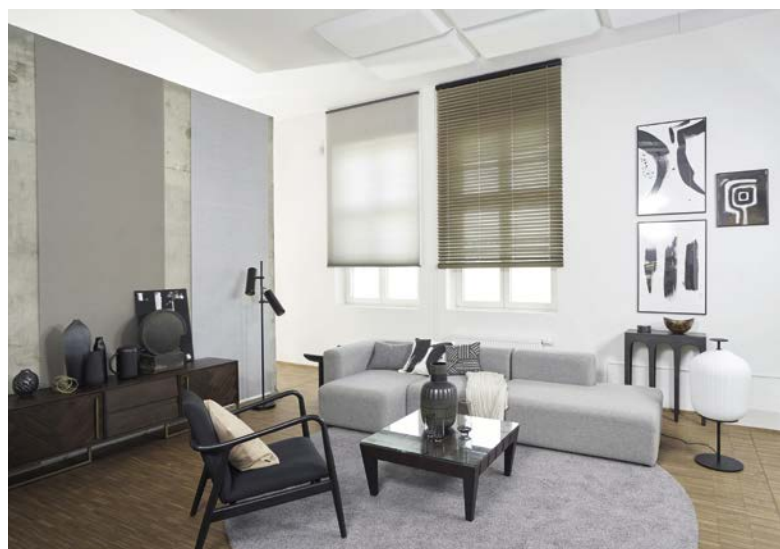
In Kassel wurden die vielfältigen Produkte von Hunter Douglas stylisch in Wohnwelten vorgestellt. Links oben zum Beispiel zu sehen ist Wohnwelt AntiViral als verkabelte Motorisierungslösung mit antiviralem Gewebe. Rechts unten steht wiederum die japandi Wohnwelt im Mittelpunkt, die PowerView in Szene setzt.

fassend. Im Mittelpunkt stand die innovative Aura-Designtechnik in ihrer gesamten Komplexität: Sie eignet sich für 35 mm wie auch für 50 mm breite Jalousien und alle Bediensysteme, von der einfachen Schnurbedienung über Schnur mit Wendestab, Kettenzug, Motor, LiteRise bis hin zu MegaView, das über eine spezielle Wendetechnik die Lamellen im geöffneten Zustand stapelt und eine Megaansicht erzielt. Erstmals bietet die Aura 50 Designtechnik auch Optionen für andere Produktgruppen, wie zum Beispiel Raffrollo, auch in großen Breiten.