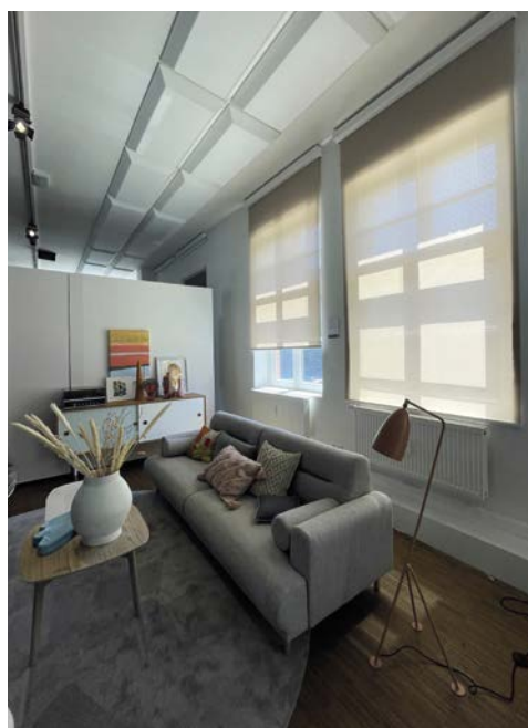
Die Wohnwelt Smooth Sorbet mit Bliss EOS Xcel Rollos 50 2 war ebenfalls ansprechend aufgebaut.

„green giving“ steht für eine stilvolle Einrichtung und einen bewussten Lebensstil. Natürliche Elemente in hellen Hölzern gepaart mit Möbeln und Accessoires in Naturtönen und Grünvarianten prägen dieses Ambiente, in dem Wert auf Nachhaltigkeit und Unkompliziertheit in Form und Anwendung gelegt wird. Das ist die Welt von ease smart blinds. Die in-