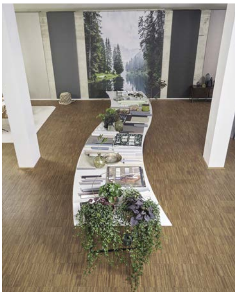
Mit viel Liebe zum Detail wurden die Produktinnovationen von Hunter Douglas präsentiert.

Das Gespräch mit den Kunden und die gemeinsame Entwicklung erfolgreicher Partnerschaften standen also im Mittelpunkt. Der Südflügel des Kasseler Kulturbahnhofes bot dafür den richtigen Rahmen: Passend zur documenta, der weltweit bedeutendsten Ausstellung zeitgenössischer Kunst, wurden aktuelle Innovationen wie auch visionäre Entwick-